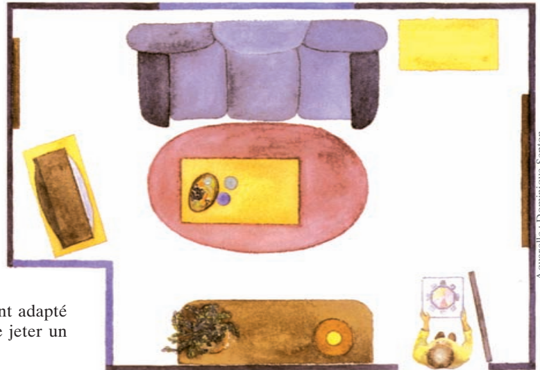
1. Pour délimiter clairement l'emplacement des zones du Ba gua dans une pièce, placez-vous juste dans l'entrée munis de votre carte du Ba Gua.

Par exemple, à la zone réputation - le tiers central du mur qui fait face à la porte d'une pièce - s'associe le Feu, le rouge et la lumière (" Li ", associé à la conscience). Cette zone centrale forme la première rencontre avec un lieu et signera - telle une poignée de mains - l'image de soi et de la famille. L'Eau et les teintes bleues y sont déconseillées, car antagonistes à l'expansion Yang du Feu : l'Eau et le Feu génèrent un conflit latent dans notre "corps ultime" rejaillissant sur notre inconscient. Notre expansion sociale et notre affirmation de soi - alors en conflit subtil - créent