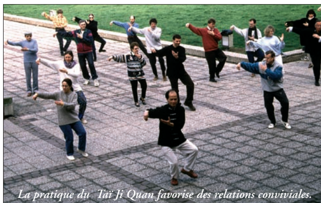
La pratique du Tai Ji Quan favorise des relations conviviales.

Il demande à ses élèves de bien respecter les étapes préparatoires et d'avoir une pratique régulière et assidue. Pour les élèves les plus aguerris, il n'hésite pas à approfondir le travail de recherche : applications martiales, tui shou, etc. Pour bien préparer les élèves qui se destinent à l'enseignement et qui auront à se présenter à d'éventuels examens fédéraux ( !!! ), il a également mis au point des tests de niveaux qui permettent au pratiquant de se positionner exactement dans leur pratique mais aussi de s'habituer au "stress de l'examen".