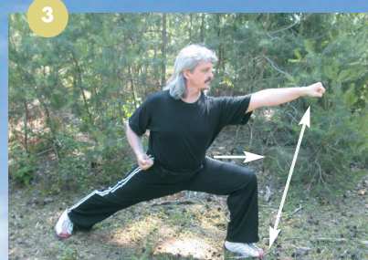
Même dans les styles dits externes, l'apprentissage commence hélas toujours par cette première technique qui fige le pratiquant dans un déplacement contrarié (3). Il serait plus judicieux de commencer par des techniques respectant la torsion (4) avant d'intégrer d'autres gestes spécifiques de la discipline.