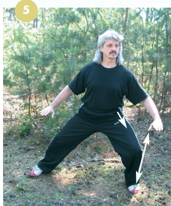
Le pas de l'ours en Qi Gong accentue le balancement sur les côtés.