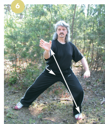
Le pas du tigre en Qi Gong insiste sur la spirale. La torsion est accentuée pour restaurer la sensation de puissance et surtout, la vélocité du fauve.