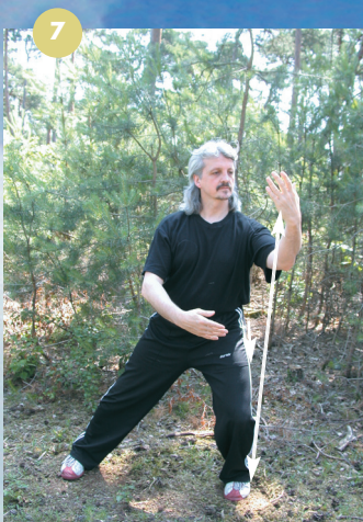
Balayer les nuages (version contrariée) : le déplacement s'effectue par un balancement latéral (épaule, bras hanches et jambes).