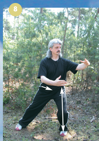
Balayer les nuages en respectant la torsion : chercher à prendre appui sur le lien croisé avec le bras opposé afin d'équilibrer le déplacement.