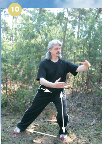
Pour être sûr de réussir correctement le mouvement — balayer les nuages —, nous vous proposons un truc : vous déplacer en reculant pour vérifier et réajuster plus facilement la réalisation correcte de la torsion pendant le déplacement, avant de replacer ce geste technique dans son déplacement originel.