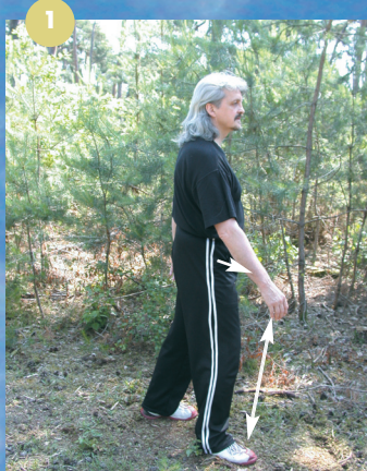
La marche contrariée : la torsion est inexistante, la jambe et le bras qui avancent en même temps entraînent un balancement sur les côtés, et allègent la jambe à déplacer.

Mais revenons à des considérations anatomiques : lorsque nous nous déplaçons, notre colonne vertébrale se torsade, le bras qui s'avance croisant avec la jambe opposée. Alors, pourquoi ne pas avoir intégré dans l'apprentissage le fait de débiter par des techniques conformes à la bio mécanique naturelle issue de notre évolution? Ceci permettrait de s'appuyer sur le naturel pour progresser plus rapidement. Et d'abord, dans un deuxième temps seulement, d'autres gestes bras-jambes latéralisés du même côté, spécifiques à nos pratiques martiales issues du maniement