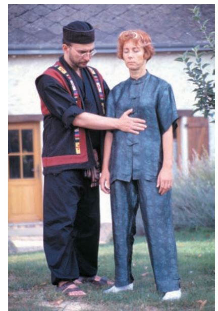
Transmission d'énergie sur le corps émotionnel

Renseignements : École Kun Lun Chan Tao. Association "l'Ermitage" Tél. mobile : 06 60 23 52 63 Ermitage des Carnutes 10 hameau de Villardon 28200 LOGRON Soins et massages S.R.V. Paris et Eure et Loir Tél. : 01 43 38 73 85