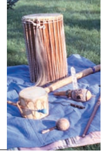
Le son du bâton de pluie nettoie les corps subtils