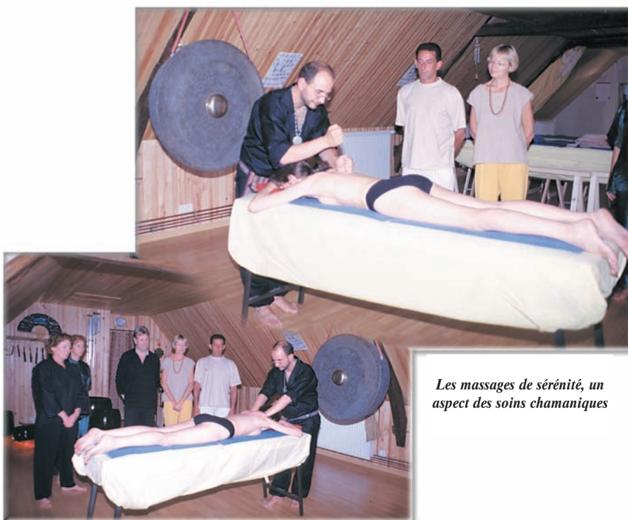
Les massages de sérénité, un aspect des soins chamaniques

Oui, bien sûr, cela passe par beaucoup d'amour. Il faut savoir donner, mais donner avec discernement, en procédant par étapes. Aujourd'hui, le temple