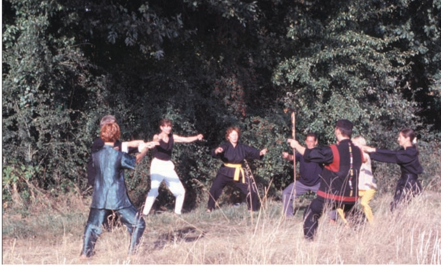
La pratique en cercle sacré permet de protéger le groupe des énergies perverses

ivrait, jusqu'au jour où, aveuglé par le désir, il ne vit le ravin au fond de la forêt et y tomba mortellement blessé. Mais avant de rendre son dernier soupir, il se blottit et lécha son poitrail et découvrit que l'odeur si agréable qui lui fit perdre la raison, venait de lui-même". Ainsi, comme le chevreau, l'homme court vers l'extérieur, alors que ce qu'il cherche se trouve à l'intérieur. Cela est vide et plein en même temps, c'est le Tao. Lorsque l'homme aura compris cela, non pas avec son mental mais avec son cœur, celui-ci, telle une rose, s'épanouira et laissera apparaître l'esprit du Tao dans l'intégralité de son être.