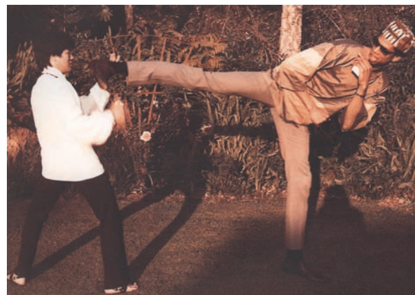
Bruce et son ami musulman Kareem Abdul Jabbar, mythique basketteur Américain et acteur dans "le Jeu de la mort".