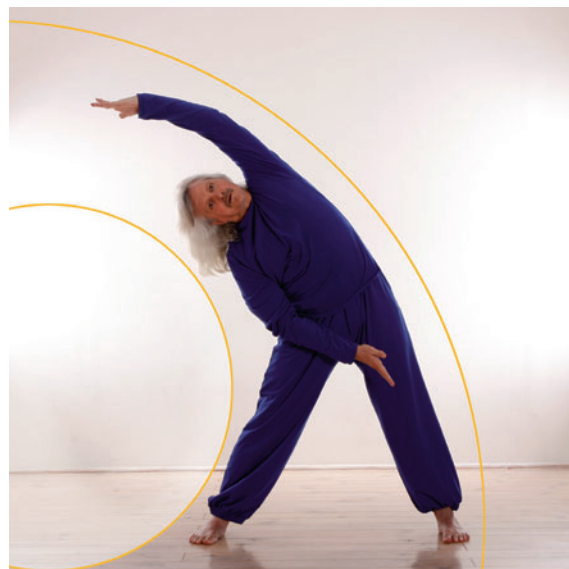
2. On retrouve l'arc latéral de l'autre côté.