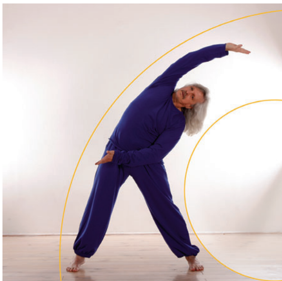
1. On retrouve l'arc latéral du mouvement « Décrocher la lune ».

Vous retrouvez dans ce mouvement l'exploration de tous les arcs/voûtes de la colonne vertébrale initiés dans la pratique du Wutao: antérieur, postérieur, latéraux et de tous les mouvements de l'onde: ondulatoire, oscillatoire et spiralé.