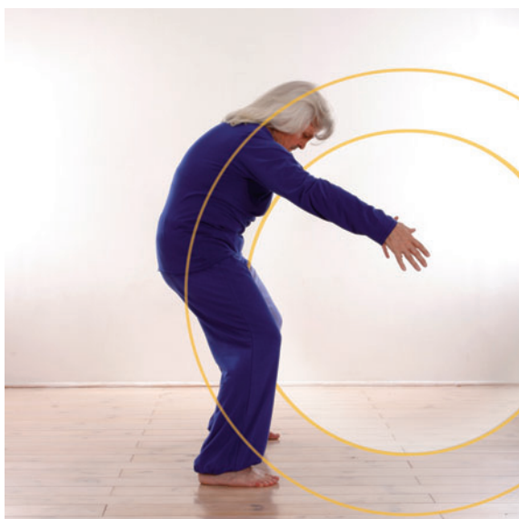
3. On retrouve le relâcher du coccyx-sacrum du deuxième mouvement « Se laisser glisser au fond de l'eau ».