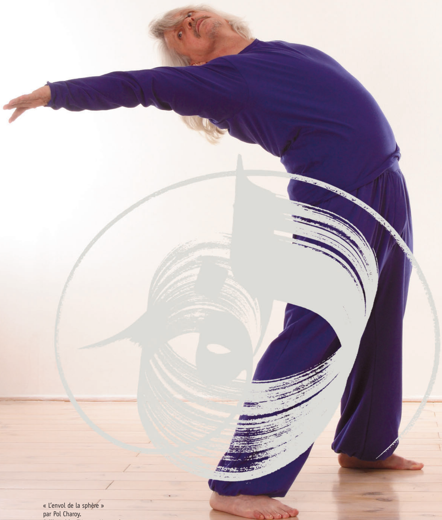
« L'envol de la sphère » par Pol Charoy. Calligraphie d'Hassan Massoudy. Créa: Séverine Montagne.