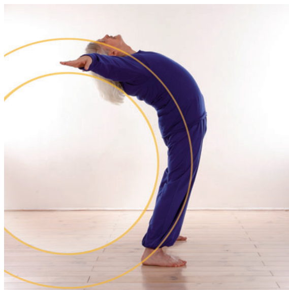
11. On retrouve la pleine extension de l'onde YIN-yang de « L'ouverture du cœur ».

Retrouvez les conseils concernant ce mouvement: ce qu'il ne faut pas faire, le placement juste, ses variations et l'ensemble de sa progression dans le livre du Wutao. Éditions Le Courrier du Livre: www.editions-tredaniel.com