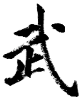
Wushu, les "Arts martiaux"

Ces danses guerrières permettaient parfois de remporter la victoire en dernière extrémité, comme on le décrit dans le livre Shang Hai Jien. L'auteur raconte l'histoire d'une bataille entre deux clans. Les vaincus se font couper la tête par les vainqueurs. Qu'importe ! Les décapités se fabriquent une tête en figurant les yeux avec leurs mamelons, et la bouche avec leur nombril. Ils se mettent ensuite à interpréter une danse guerrière et font ainsi fuir l'ennemi ! Cet événement constitue le premier "bourgeon" du taolu.