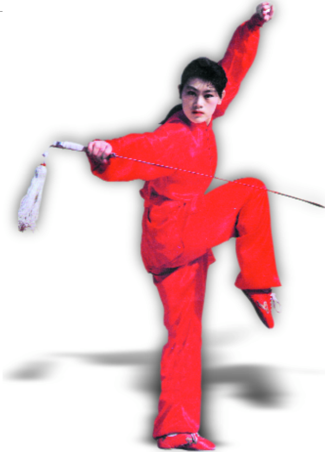
Championne chinoise des années quatre vingt.

1) Les taolu ont été organisés pour des pratiques à mains nues ou avec armes, en exercices individuels ou collectifs. Ils sont codifiés en :