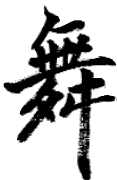
Wutao, la "danse"

Le lien étroit entre le taolu de Wushu (les arts martiaux) et le Wutao (la danse) rapparaît dans leur nom même, par la racine commune Wu.