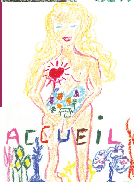
Dessin n° 2 : Le dessin d'Ophélie (une femme debout, les pieds tournés vers l'avenir) révèle une réconciliation avec le féminin.