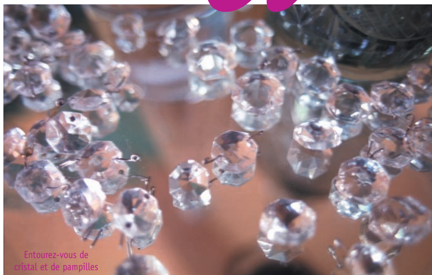
Entourez-vous de cristal et de pampilles

par Alexandra Virag et Bruno Colet, fondateurs de l'Académie de Feng Shui Occidental