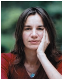
par Delphine L'huillier