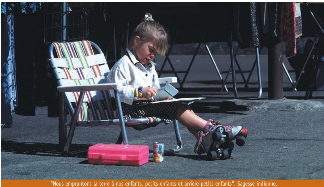
"Nous empruntons la terre à nos enfants, petits-enfants et arrière-petits enfants". Sagesse indienne.

des caractéristiques des Créatifs Culturels, le fait de voir que tout est lié.