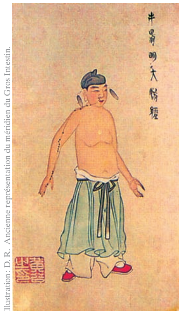
Illustration: D. R. Ancienne représentation du méridien du Gros Intestin.

Pendant tout le 2 e millénaire, avec le développement de la médecine chinoise, les techniques pour faire circuler l'énergie sont très répandues: de nombreux médecins de l'époque utilisent les méthodes de Dao Yin. Toutes les méthodes s'expliquent plus clairement par l'aboutissement des théories de la médecine chinoise comme le Yin et le Yang, les cinq organes, l'énergie et le sang, les méridiens... Elles se simplifient et se rationalisent avec les connaissances plus précises. Ainsi le Dao Yin sert à faire circuler l'énergie et le sang, à renforcer et à assouplir les articulations.