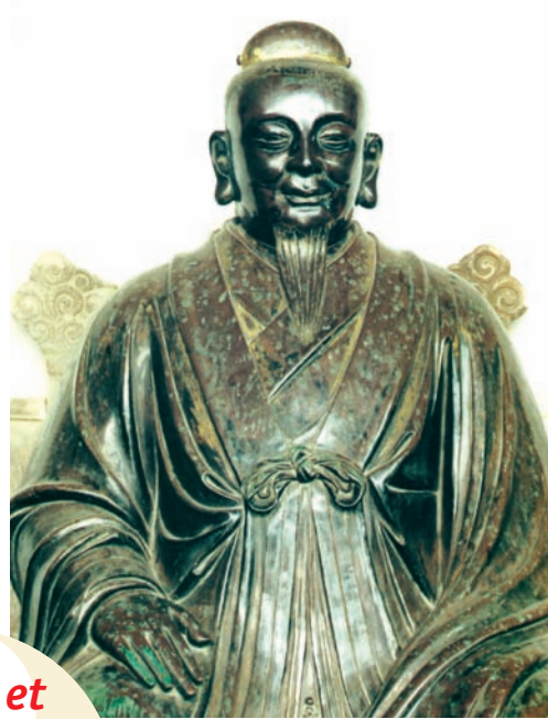
Zhang San Feng, maître taoïste fondateur des arts martiaux « internes » du temple de Wudang.

Pendant la période très riche des Tang (entre le 6 e et le 9 e siècle), plusieurs artistes et poètes, qui fréquentaient ces médecins, taoïstes, bouddhistes, pratiquent aussi les méthodes énergétiques. Ils développent leur créativité et leur inspiration. Il n'y a pas alors de séparation rigide entre taoïstes, bouddhistes, poètes et méde-