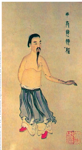
Illustration: D. R. Ancienne représentation de méridien.