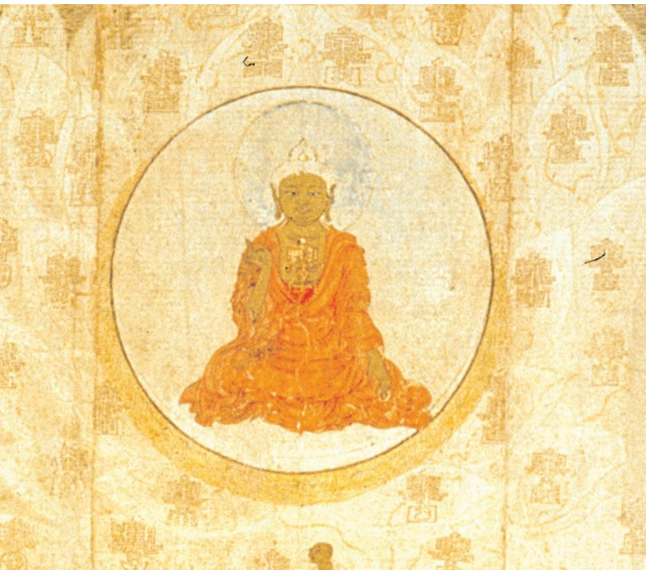
Image bouddhiste Chang Sheng-Wen - Dynastie Sung.