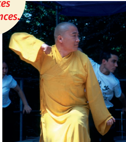
Le Qi Gong « martial » remonte au 7 e siècle et à l'enseignement donné par le moine Damo au temple Shaolin.

Serein et imprévisible en toutes circonstances.