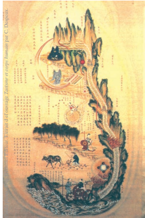
Une représentation de l'alchimie taoïste : le Neijing Tu peint par le Ruyi guan. Tiré du Zhongguo gudai yishi tulu .

Cette distinction ne peut servir qu'à repérer des jalons de développement des arts énergétiques en Chine. La réalité est bien plus entremêlée entre bouddhisme, taoïsme et médecine chinoise. Les grands médecins des anciens temps possédaient une profonde culture taoïste. Le courant « Chan » du bouddhisme ne puise-t-il pas ses racines dans le taoïsme ? Les grands poètes de la dynastie des Tang n'ont-ils pas été taoïstes puis bouddhistes, mêlant à leur