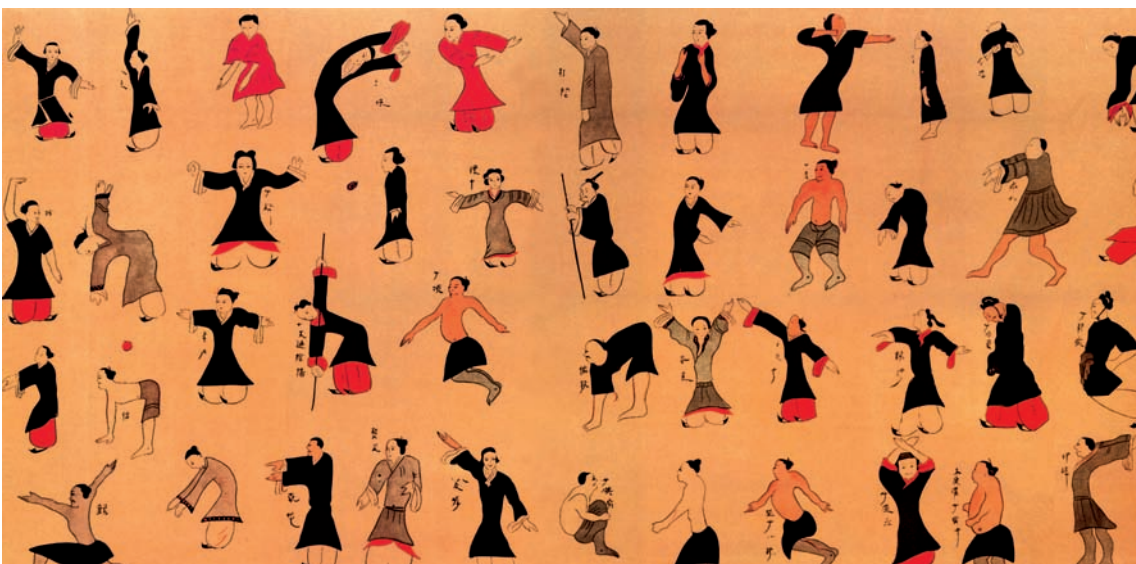
Illustration: le fameux dessin du Dao Yin découvert en 1973 dans un tombeau de la dynastie de Han (168 avt J.-C.), à Ma Wang Dui.