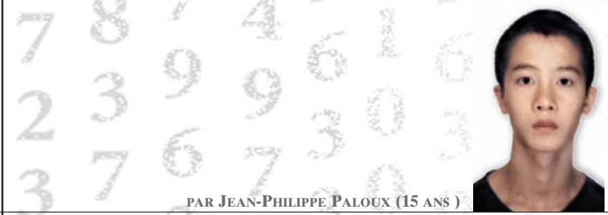
PAR JEAN-PHILIPPE PALOUX (15 ANS)