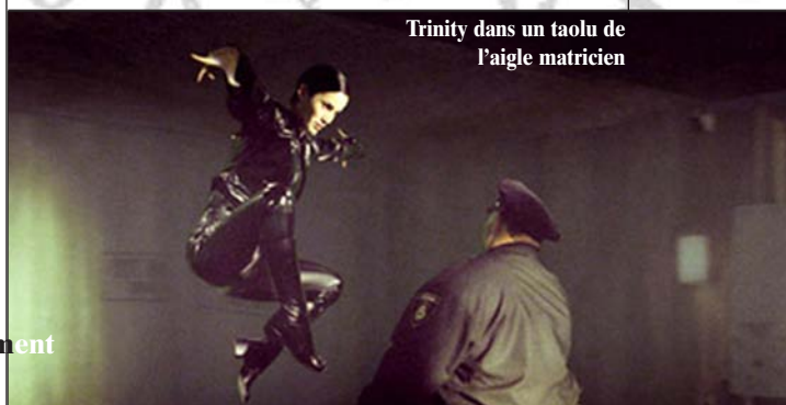
Trinity dans un taolu de l'aigle matricien

Les cascades, les combats, omniprésents dans "Matrix", participent elles-aussi au changement. Les concepteurs du film ont longuement réfléchi, et ont compris qu'il serait difficile de faire une révolution sans révolution physique, l'un n'allant presque jamais