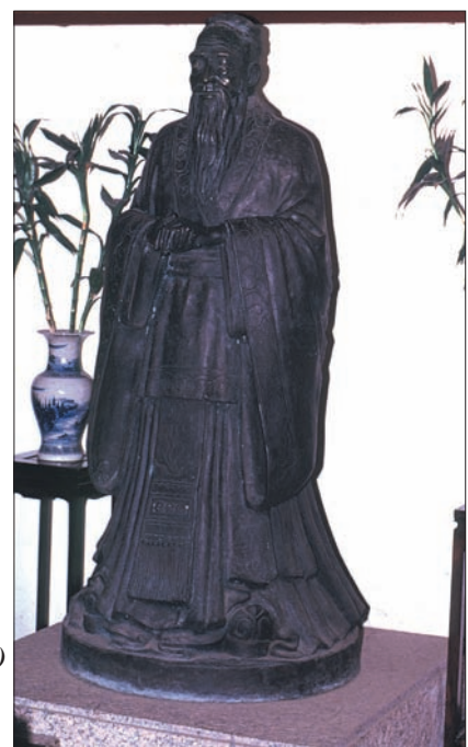
Confucius (vers 551-479 avant J.C.)

Déjà, dès la première dynastie des Shang (-1750 à -1050), la Chine rendit un culte au Shang-Di (Empereur d'En Haut) ; dès la seconde dynastie des Chou (-1050 à -206), apparut le culte du Ciel. L'Empereur seul offre un