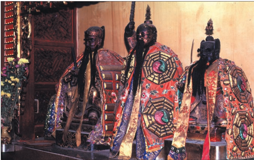
Le rituel des offrandes tient une place importante dans le culte taoïste

L e prophète, le mystique et le sage. Dans la plupart des manuels traitant de l'histoire des religions du monde, on ne tient compte que des grandes religions d'origine sémitique (de caractère prophétique), et d'origine indienne (de caractère mystique), en reléguant les religions exotiques en un appendice extrême-oriental.