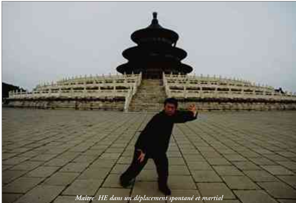
Maître HE dans un déplacement spontané et martial

un respect réciproque les unirent. Lorsqu'ils se quittèrent, M. XIE déclara :