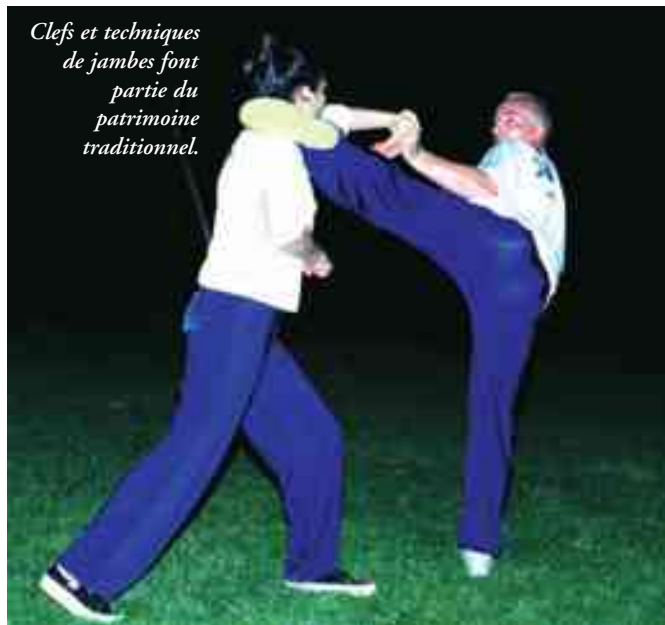
Clefs et techniques de jambes font partie du patrimoine traditionnel.