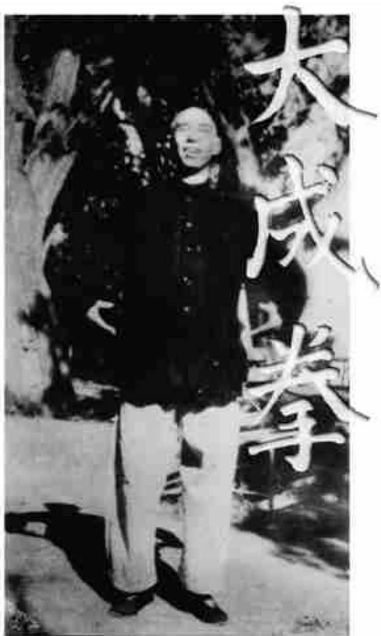
Le Maître-fondateur du Da Cheng Quan, WANG Xiangzhai (1885-1963).

Le Da Cheng Quan est un art martial à la frontière de l'interne et de l'externe. Il a été mis au point par le grand maître Wang Xiangzhai qui a fusionné en une seule technique les avantages de différentes écoles.