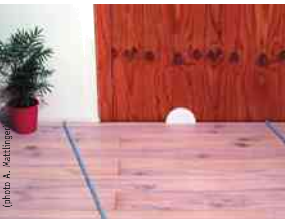
Ci-dessus, un moduleur biofréquentiel en céramique active posé sur le trajet d'un cours d'eau souterrain.

trique dans tout le lieu de vie. Selon le même principe, un autre exemple d'utilisation de moduleur bio-fréquentiel consiste à transformer l'énergie destructurante d'un cours d'eau souterrain en énergie revitalisante par la pose d'une céramique sur le trajet du cours d'eau (symbolisé par les deux baguettes bleues sur la photo ci-contre).