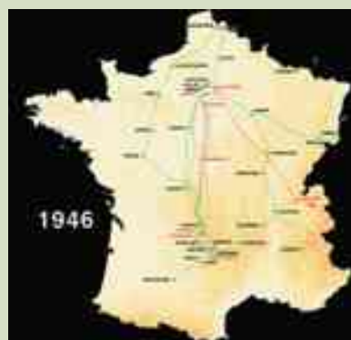
En 1946 : L'ancien réseau haute tension 225 kV (en rouge) et les projets de réseau très haute tension) en 400 kV (en vert pointillé).

Il y a en France plus de 600 000 km de lignes électriques, 15 millions de poteaux électriques et 250 000 pylônes. A noter : l'enfouissement des lignes à haute tension (3 % des lignes en France, 25 % en Allemagne), s'il atténue le champ électrique en surface, est sans effet sur le champ magnétique. Ce dernier pourra même être plus intense car la ligne est plus proche des gens (2 m) que dans le cas des câbles aériens (6 m).