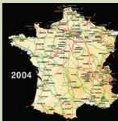
En 2004 : Le réseau actuel très haute tension en 400 kV (en rouge), en 225 kV (en vert).