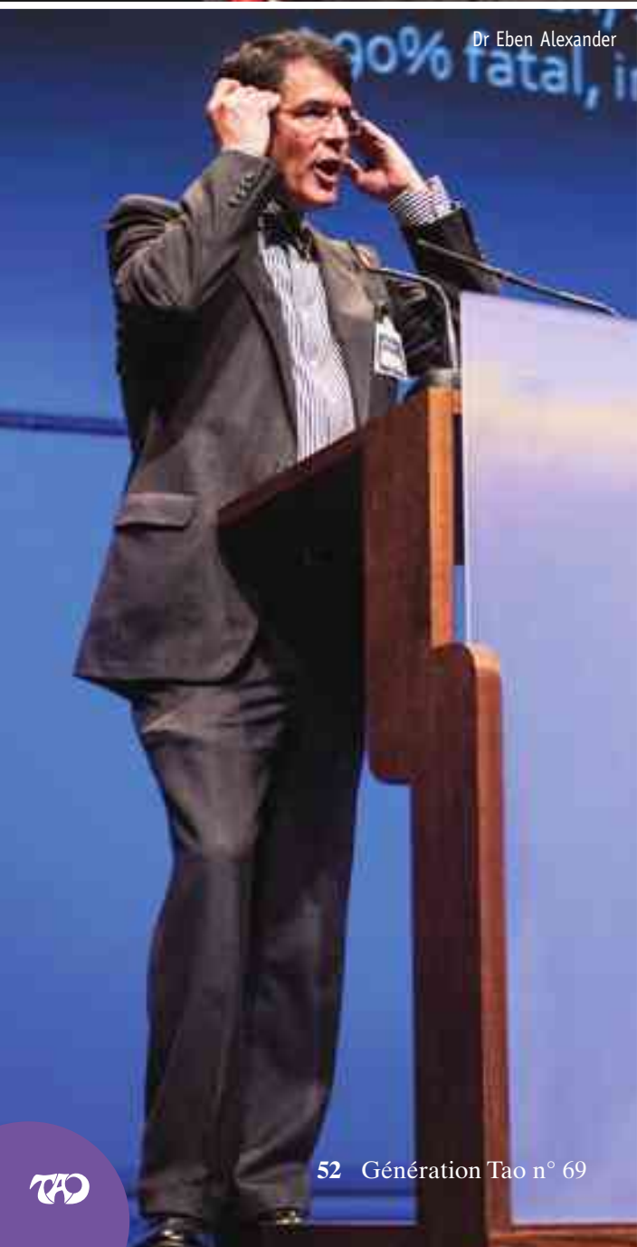
Dr Eben Alexander