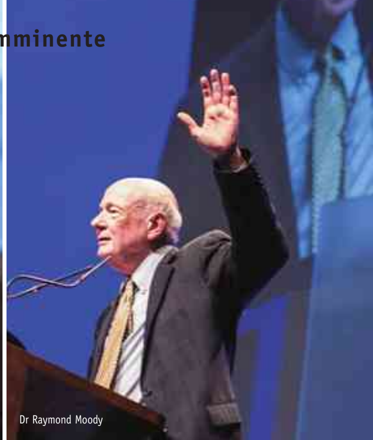
Dr Raymond Moody