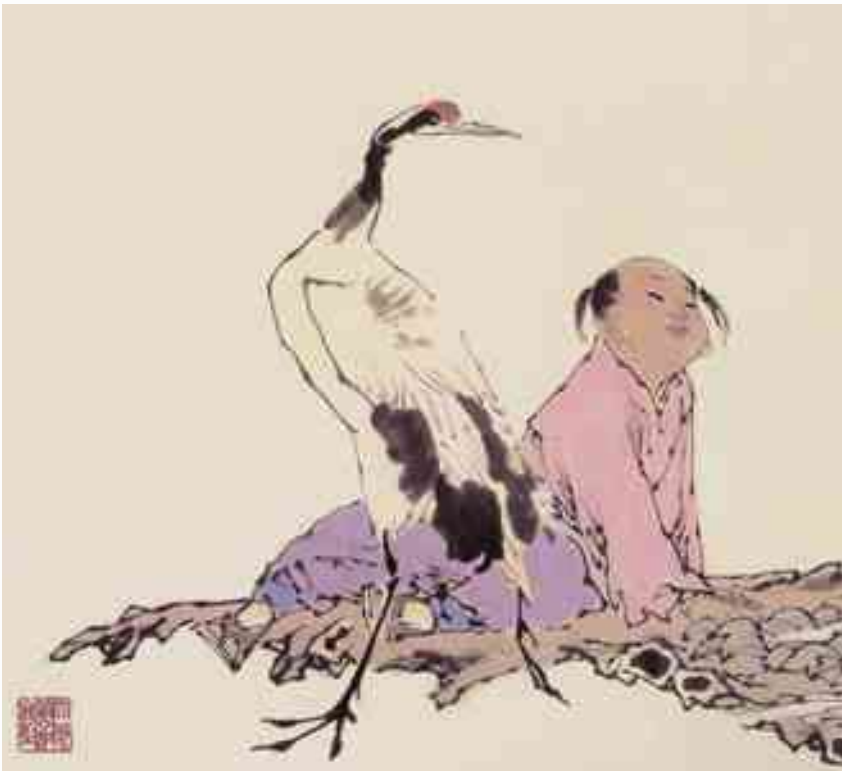
Illustration : copyright Le Vieux Sage et l'Enfant par Fan Zeng • Editions Albin Michel • 2005

courant pour désigner ceux qui s'adonnaient à cette recherche est : xian : 仙 . Il est composé de l'association du signe général des êtres humains avec celui de la montagne. Il désigne tous les grands taoïstes, à la fois les ermites qui vivent dans les montagnes et les maîtres qui ont acquis le calme et la stabilité des montagnes, et dont le cœur apaisé est devenu aussi insensible aux passions humaines que les sommets des montagnes aux nuages qui s'y écharpent.