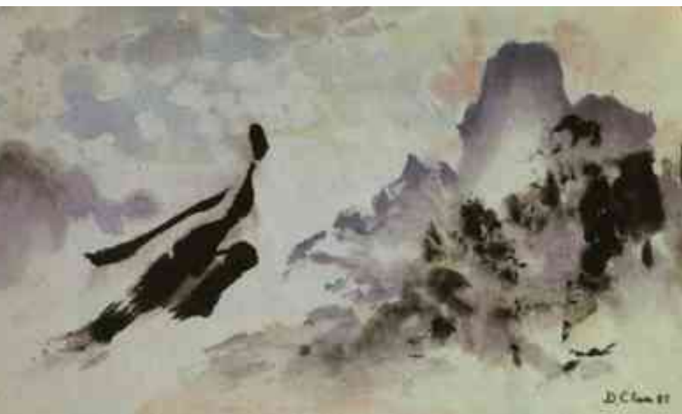
Crédit Illustration : Cyrille J.-D. Javary. Illus. Chen Dehong. L'empereur et l'immortel • textes P. Aroneanu • éd. Ipomée-Albin Michel • 1994.

constitue pour l'esprit chinois le bien commun à toutes les créatures vivantes. A la différence de la « vie », le « vivre » s'accorde mal d'un adjectif possessif. Dès lors, quand l'universitaire François Jullien, connaisseur réputé de la pensée philosophique chinoise, titre le récent ouvrage qu'il a consacré aux pratiques corporelles chinoises Nourrir sa vie , il manque son but ; à rendre l'expression Yang Sheng en bon français, il l'affadit. Pour l'esprit chinois en effet, le « vivre » est bien plus que la sensation que chacun d'entre nous a d'être vivant. Illimité, sans commencement discernable, et sans fin prévisible, le « vivre » habite la terre, s'y manifeste dans la continuité des saisons et s'y incarne l'infinie variété des « dix mille êtres ». Ce « vivre » là n'a pas grand-chose à voir avec l'immortalité. Aucun humain ne peut se l'approprier. S'il fallait le rapprocher de notions qui nous sont plus familières, ce serait cet « élan vital » dont Bergson parlait avec des mots si simples.