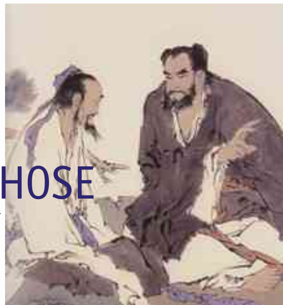
Illustration : copyright Le Vieux Sage et l'Enfant par Fan Zeng Editions Albin Michel • 2005

Le Mystère, le Tao, est l'ancêtre originel de la nature, le grand aïeul de toutes les diversités. Il s'étend à l'infini, s'étend plus loin que les huit directions. Tantôt il apparaît éblouissant, puis s'évanouit comme une ombre. Il Est quand il prend forme en toute chose. Là où le Mystère n'est plus, le corps dépérit et l'esprit meurt. Baopu zi