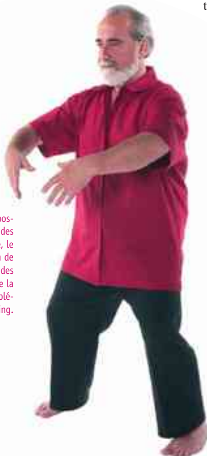
Fig. 1: Dans Zhang Zuong Gong , la posture de l'arbre, la position fléchie des genoux, la respiration abdominale, le maintien du périnée, la captation de l'énergie de la Terre par la plante des pieds et du Ciel par le sommet de la tête contribuent à fabriquer un supplément d'énergie Jing.

Cette énergie séminale, Jing, ainsi cultivée, le pratiquant ne va pas la dilapider, mais la transformer, soit pour se soigner, s'il est gravement malade, soit pour la transformer en