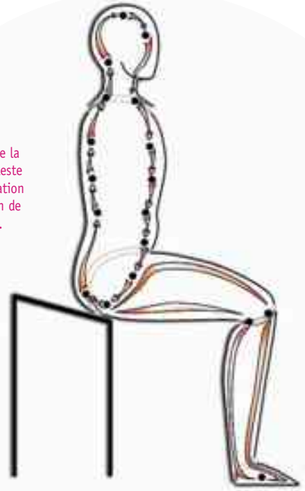
Fig. 2: L'ouverture de la petite circulation céleste favorise la transformation du Jing en expansion de conscience, Shen.

Illustration: Imanou risselard, d'après l'ouvrage «Eveille l'énergie curative du Tao», par Mantak Chia, Guy Trédaniel éditeur.