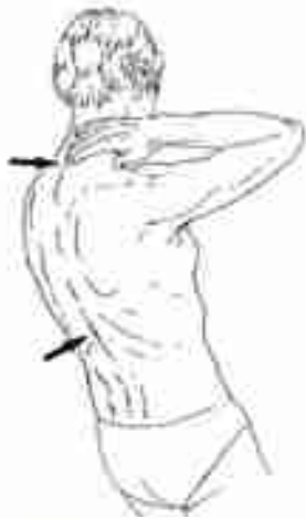
Expiration costale, proche du mouvement naturel du soupir.

Dans la technique que vous pratiquez, l'accent est-il mis sur le moment ou le flux d'air entre dans les poumons, ou au contraire le moment où ce flux d'air sort des poumons ? Attention, cela n'a pas forcément à voir avec le geste qui est en train de se produire : certaines inspirations peuvent se faire avec des gestes qui semblent expiratoires, et certaines expirations avec des gestes inspiratoires... Vous vous rendez vite compte que d'une situation à l'autre, cela peut être très différent, alors que l'on parle toujours de respiration. Dans de nombreuses techniques de relaxation par exemple, l'attention est portée sur le temps expiratoire, qui va accompagner le fait de se décontracter. « Respirer par le ventre », au contraire, sous-entend presque toujours inspirer par le ventre, alors que lorsqu'on parle à une femme qui accouche de respiration, parfois il s'agit bien d'inspirer — c'était le cas dans la fameuse respiration du « petit chien » dans les premières techniques d'accouchement sans douleur —, parfois il s'agit d'expiration —.