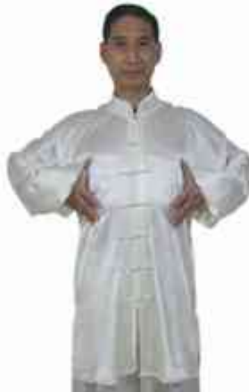
Comme vous pouvez le constater, dans les boxes dites externes, l'inspir se concentre au niveau poitrine.