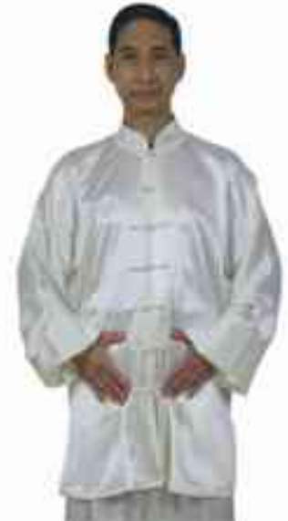
Ici, dans les boxes internes, l'inspir se situe au niveau de la ceinture abdominale.

chronisation intègre les mouvements de la respiration qui permettent de déployer les fonctions du corps. Reste à savoir si dans les boxes internes il est nécessaire ou non de cultiver les techniques respiratoires de manière à part entière ou non. Shun et Ni sont, comme nous l'avons dit, des respirations naturelles. Aussi dans nos pratiques, faut-il oublier la respiration comme dans notre vie quotidienne. En Chine, en ce qui concerne la pratique du Tai Ji Quan, deux opinions se contredisent : certains pratiquants pensent qu'il ne faut pas penser à la respiration. D'autres pensent qu'il faut synchroniser la respiration aux mouvements. Pour ma part, j'opterais pour le premier point de vue. Si nous forçons le changement de notre rythme respiratoire, en effet, nous changeons les circonstances de la nature et sa tranquillité est rompue. De plus, chaque personne suit son propre rythme de pratique. Ce n'est qu'au moment de la construction de la synchronisation des différentes parties de notre corps que la respiration peut vraiment rejoindre cette synchronisation et participer à la liaison des différentes parties du corps. Cette adaptation s'est faite à notre insu, sans volonté de notre part. Dans la pratique, je rejoins les paroles de Lao Zi : Wu wei, er wu ba wei , que l'on pourrait traduire par : « Sans volonté et sans intention de l'utiliser », mais la respiration doit tout de même être entraînée à être utilisée dans toutes les circonstances. ■