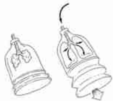
L'élasticité des poumons: c'est un appel d'air vers l'intérieur des poumons qui produit l'inspiration.

« non actif », au sens où il n'est pas fait par des actions musculaires, mais juste par une force passive élastique. Ce retour du poumon est puissant, mais il n'est pas complet: il reste encore un peu d'air, ensuite, dans les poumons. C'est même un volume assez important. Si on continue, on a alors une phase expiratoire très différente de la précédente. Pour chasser le volume qui subsiste, il faudra maintenant « comprimer les poumons », soit en abaissant les côtes, (par les muscles expirateurs costaux), soit en refoulant