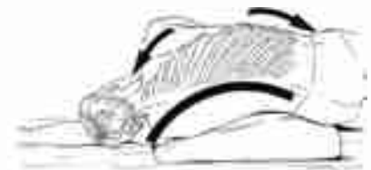
Les muscles situés entre les côtes peuvent être d'une grande souplesse qu'il est possible d'entretenir par des exercices qui vont aider la respiration.

Indépendamment du fait que l'on soit dans l'inspir ou l'expir, du fait que les volumes respiratoires sont amples ou non, il y a un troisième élément d'observation : regardez bien quelle est la partie du tronc qui bouge pour respirer : est-ce plutôt la cage thoracique ou plutôt la région du ventre ? Bien sûr, le mouvement que fait le corps pour respirer peut prendre de très nombreuses formes. Mais toutes se ramènent à deux mouvements types fondamentaux : ceux qui font jouer les côtes (qui les ouvrent, à l'inspir, et qui les ferment à l'expir), et ceux qui font jouer le caisson abdominal — l'abdomen se bombe à l'inspir, et rentre à l'expir —. Ici encore, c'est une observation capitale : ces deux types de respiration correspondent à deux façons tout à fait différentes de mobiliser les poumons, avec des conséquences différentes. Bien sûr, ils peuvent se mixer et se combiner de toutes sortes de manières. Mais il est important de distinguer à quel type s'apparente une respiration et de savoir, quand on accorde une respiration à un geste, quel type nous allons choisir et pourquoi.